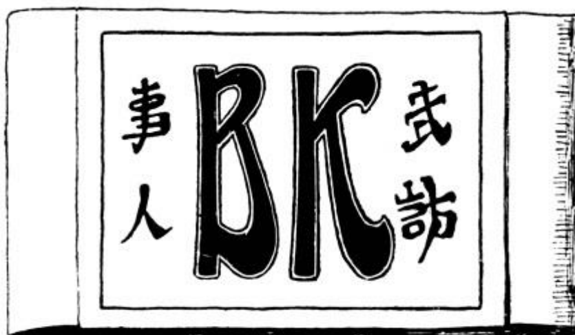
Перевязь, установленная для ношения на левой руке) военными корреспондентами в действующей армии. Рис. В. Табурина.

Более того, В.А. Табурин также размышлял и о предназначении репортера на театре войны, о его неперемных качествах в профессиональном отношении. В 1906 г. он опубликовал небольшой рассказ «Ванька-Каин», обыграв аббревиатуру «ВК», которая наносилась на повязку, обязательную к ношению военными корреспондентами.