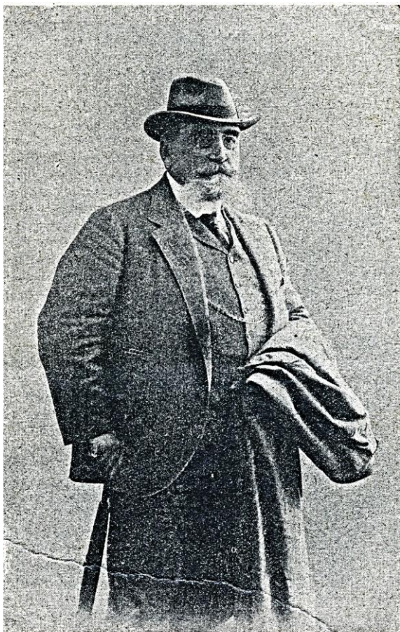
В.И. Немирович-Данченко (1845–1836)