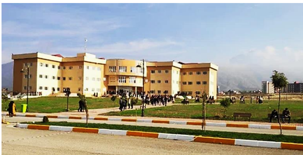
Регион Курдистан-Ирак. Университет Соран. 30 сентября 2024 г. Kurdistan Region-Iraq. Soran University. September 30, 2024