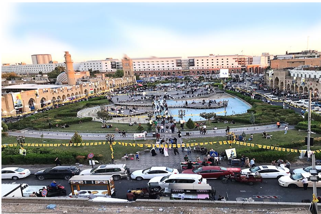
Визитная карточка г. Эрбиль. Центр На фоне цитадели. Место отдыха горожан