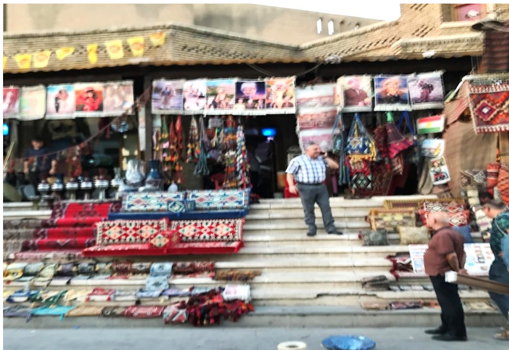
г. Эрбиль. Городской восточный рынок Erbil city. City eastern market