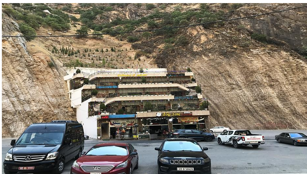
По дороге «Эрбиль – Соран». Дома врезаются в скалы On the road "Erbil – Soran". Houses cut into the rocks