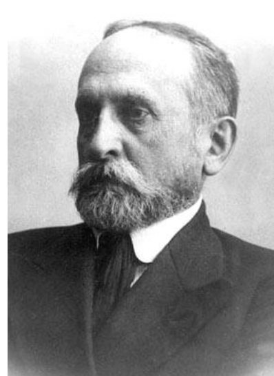
Рис. 3. С.Ф. Ольденбург

По штатному расписанию, утвержденному Александром III, с 1 января 1894 г. предусматривалось следующее ежегодное жалование ученым: ординарному академику – 4200 рублей (в том числе жалование – 2400, квартирные – 600, за звание – 1200); экстраординарному академику – 3000 рублей (в том числе жалование – 1500, квартирные – 500, за звание – 1000) [4].